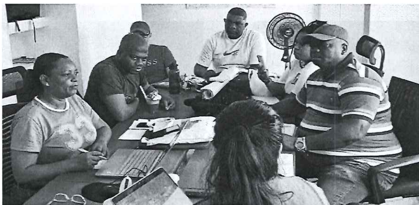
Primera Base datos organizaciones y consejos comunitarios

Hice con apoyo de los líderes comunitarios los lineamientos para comenzar a crear una base de datos donde repose las diferentes organizaciones, fundaciones grupos ecológicos los cuales estén en función de garantizar las actividades propuestas en el proyecto y darles cumplimiento a las metas y a su vez garanticen que la comunidad pueda contribuir al desarrollo de la gobernanza ambiental de sus comunidades